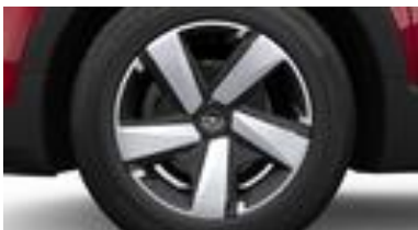
16" štruktúrované oceleové disky s strieborno-čiernym krytmi (ZHD1)