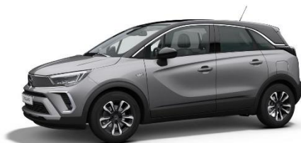
Šedá Kontrast (F4M0) 550 €