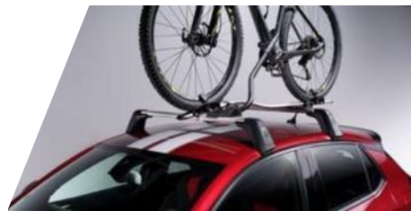
Strešný nosič bicykla Thule "Expert 298"

Rozmery: 1 330 x 860 x 370 mm. Objem: 320 l Číslo dielu: 1662444280 Cenníková cena: 289,37 €