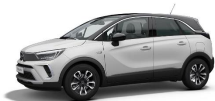
Bielá Arktis (WPP0) 0 €