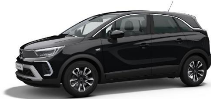
Čierna Karbon (9VM0) 550 €