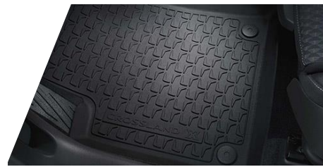
Celoročné podlahové rohože – čierne

Číslo dielu: 39240651 Cenníková cena: 88,94 €