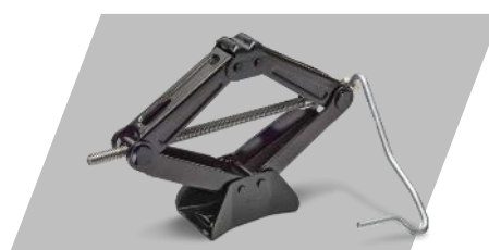
Súpravu náradia a zdvihák

Číslo dielu: 1677096680 Cenníková cena: 220 €