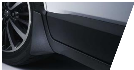
Lapače nečistôt (zásterky) predné/zadné

Číslo dielu: 39096293/ 39096294 Cenníková cena: 52,54 € / 52,36 €