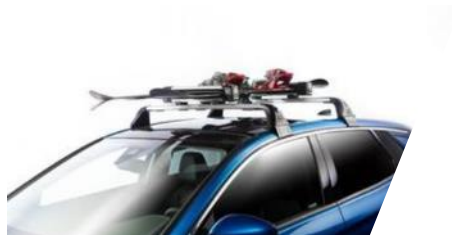
Nosič lyží/snowboardov Thule 7324, 4 páry lyží

Číslo dielu: 9858801180 Cenníková cena: 327,74 €