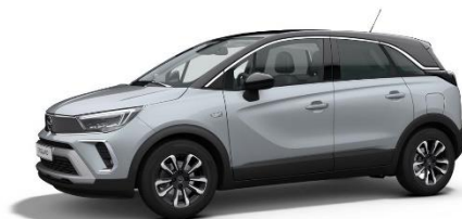
Šedá Kristall (ZRM0) 550 €