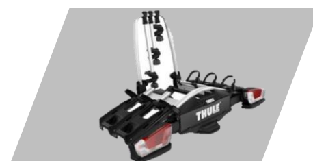
Nosič pre 3 bicykle na ťažné zariadenie "Coach 3 - 276"

Skrutkové prevedenie: 162€ Bajonetové prevedenie: 223,40 €