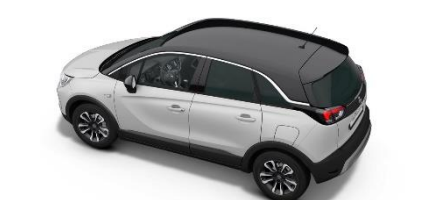
Čierna strecha Diamond Black (JD20) Edition / Elegance 150 €