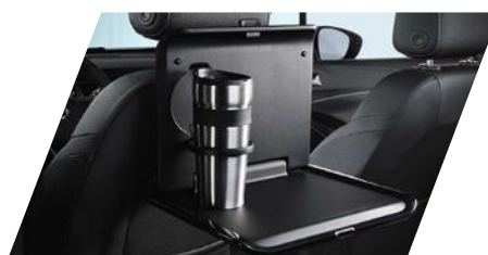
FlexConnect sklápny stolček

Číslo dielu: 9834351380 Pôvodná cena: 59 €