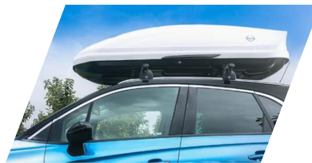
Strešný box Thule "Ocean 80,"

model so strešnými ližinami / bez strešných ližín Číslo dielu: 13474370 / 13474372 Cenníková cena: 342,23 € / 430,79 €