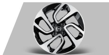
Disk z ľahkej zliatiny 16", 4 DVOJITÉ LÚČE

Číslo dielu: 1688296280 Cenníková cena: 50 €