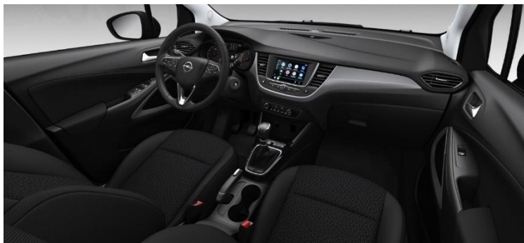
Čalúnenie látkové Peanut, čierne Jet Black R5FX