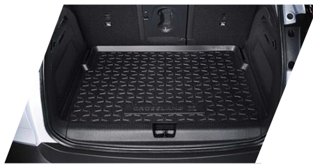
Gumová podložka do batožinového priestoru

Číslo dielu: 39096293/ 39096294 Cenníková cena: 52,54 € / 52,36 €