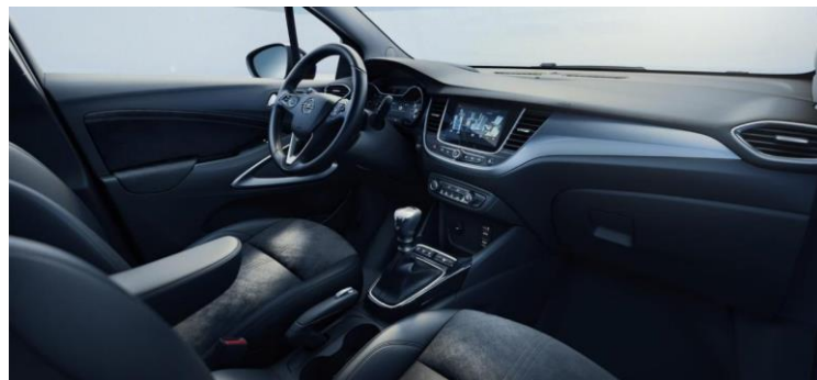
Čalúnenie kombináciou koža/látka Sparkle, čierne Jet Black, s ergonomickým sedadlom vodiča AGR – Sada Elegance – TUFX