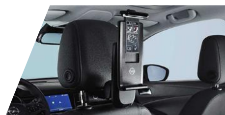
FlexConnect držiak tabletu (univerzálny)

potrebné objednať FlexConnect adaptér Číslo dielu: 9834352180 Cenníková cena: 177,11 €