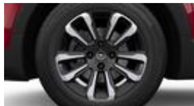
16" disky z ľahkých zliatin BiColor striebornočierne s 10 lúčmi (ZHE0/ZHE2)