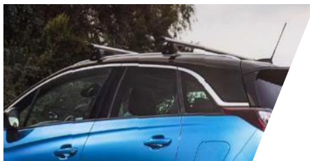
Základný nosič hliníkový Sada 2 tyčí.

Číslo dielu: 39240704 Cenníková cena: 61,58 €