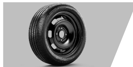
Rezervné dojazdové koleso 16"

Číslo dielu: 9858801480 Cenníková cena: 1296,72 €