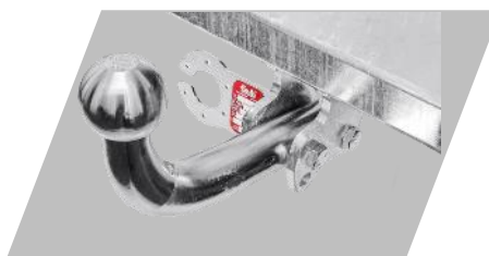
Ťažné zariadenie Galia

Skrutkové prevedenie: 162€ Bajonetové prevedenie: 223,40 €