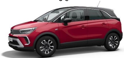
Červená Kardio (PQM0) 550 €