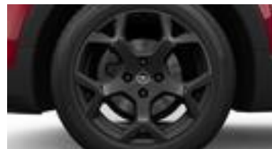
17" x 6,5J čierne disky z ľahkých zliatin so 4 dvojitémi lúčmi (ZHE5/ZHE6)